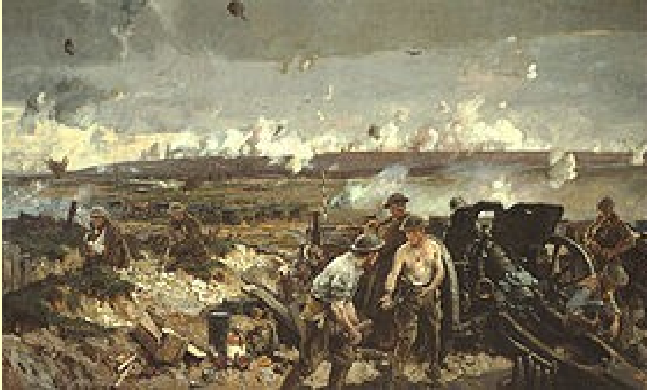
La Bataille de Vimy peinture de Richard Jack Musée canadien de la guerre

Les Français avaient comme alliés les Canadiens ainsi que les Britanniques, contre l'empire Allemand. Le commandant canadien était Julian Byng et le commandant allemand était Ludwig von Falkenhausen.